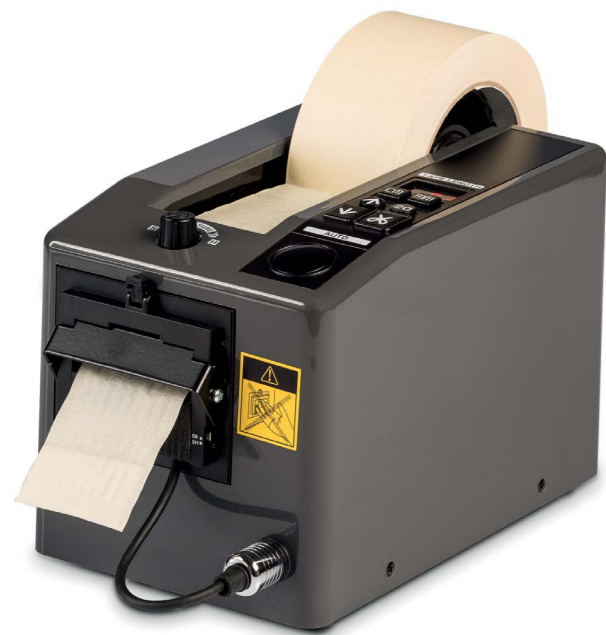
A 690N, A 691N

Die Bandlänge ist programmierbar mit 5 Speicherplätzen in Millimeterschritten. Das Gerät ist serienmäßig mit einer foto-elektrischen Abschneidevorrichtung ausgerüstet. Das Gerät A691N ist für schmale Bänder geeignet.