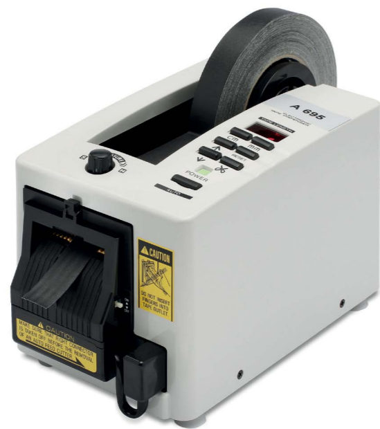
A695, A696, A697, A698

Tiefe 210mm, Breite 135mm, Höhe 150mm Gewicht : 2,7kg